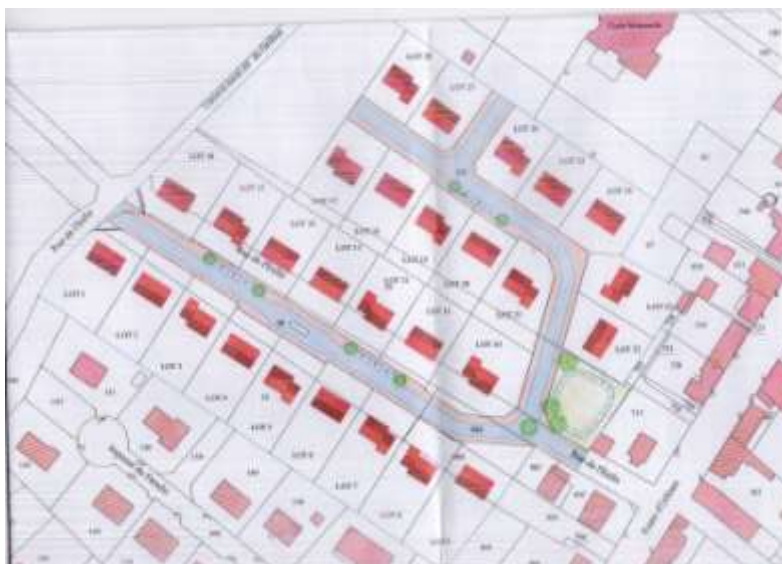
Schéma directeur « Eau Potable »

Le projet de lotissement dans sa configuration la plus probable :