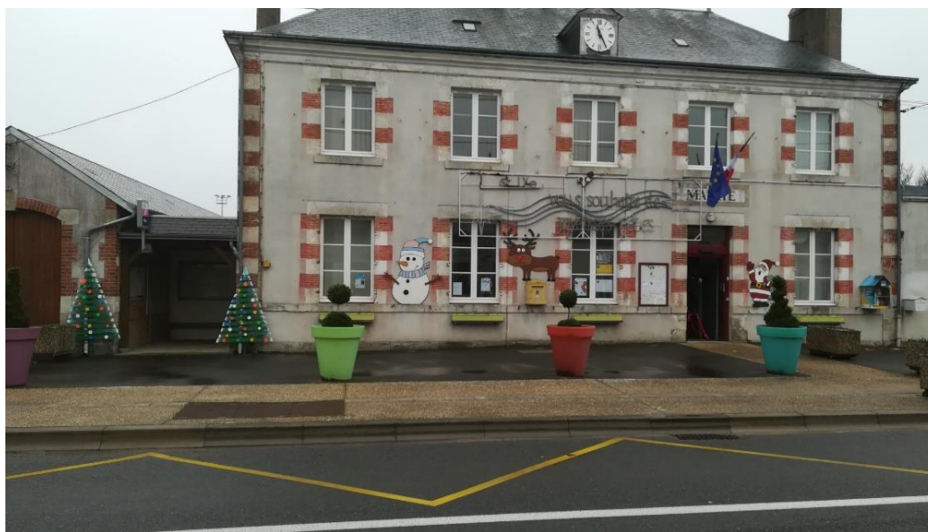
La mairie entièrement décorée de figurines réalisées en matériaux de récupération, et totalement sobres.

Nous avons pu profiter de bons moments, partager du temps avec nos proches, pour reprendre des forces et oublier pendant quelques jours ce qui nous assaille. Le tout afin d'aborder l'année 2023 avec des réserves de résilience.