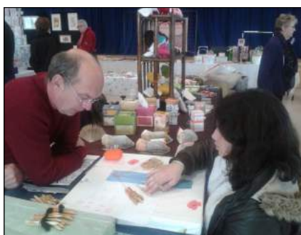
Initiation à la dentelle aux fuseaux