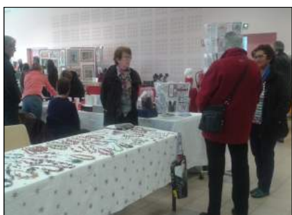
Bijoux vendus au profit du Burkina Faso

La Commission Loisirs remercie toutes les personnes qui ont accepté d'exposer leurs créations, de partager leur passion, et tous les visiteurs, qui ont contribué à la réussite de cette journée du 20 mars.