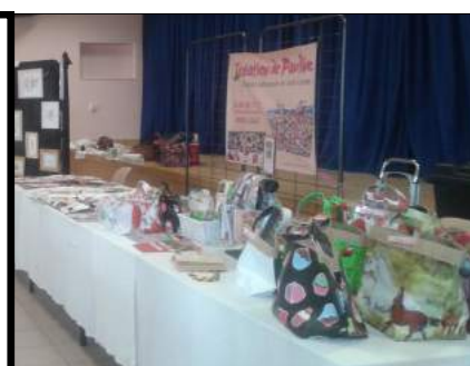
Sacs (en vente à la boulangerie)