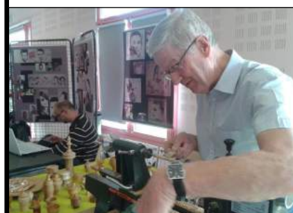
Démonstration du tour à bois